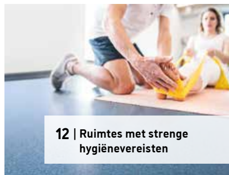
12 | Ruimtes met strenge hygiënevereisten