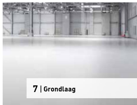
7 | Grondlaag