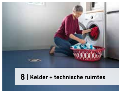
8 | Kelder + technische ruimtes