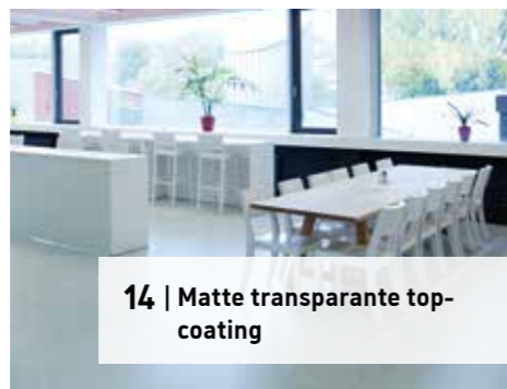
14 | Matte transparante topcoating