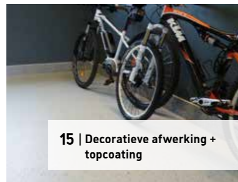
15 | Decoratieve afwerking + topcoating