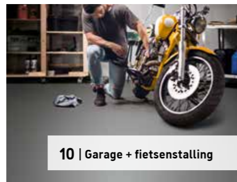
10 | Garage + fietsenstalling